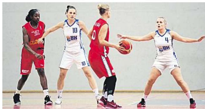
Úvodní zápas Basketbalistky Nymburka (v červeném) včera zvítězily úvodní zápas sezony, v Karlových Varech vyhrály 90:80.

I když mistrovský tým USK Praha ztratil po minulém sezoně při obměně kádru řadu opor, zůstává jasným favoritem na titul. Tudíž to nadále vypadá, že se bude hrát spíše jen o druhé místo, které v minulém